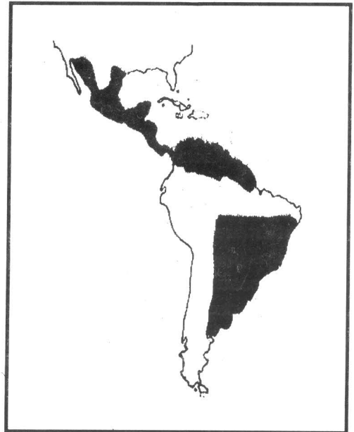
Mapa da distribuição geográfica

O "gavião-fumaça" como também é conhecido devido ao hábito de caçar inseto sobrevoando as queimadas possui uma alimentação variada. Come grandes insetos, pequenos mamíferos como os ratos e gambás, lagartos e cobras e eventualmente sapos.