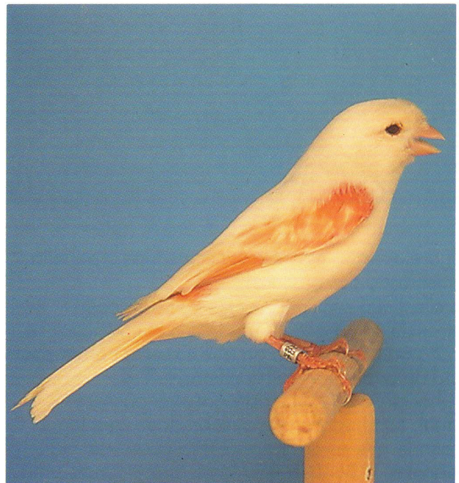
Vermelho Mosaico Fêmea